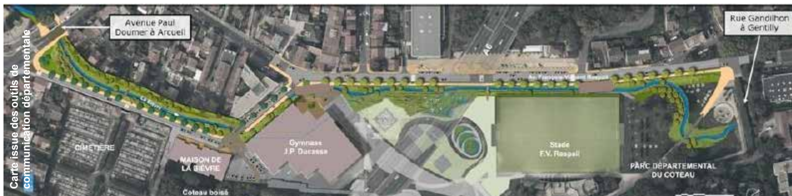
Ensemble du parcours concerné par le projet et les travaux.

Elles pourront être agrémentées par les participants de texte (onomatopées), mots clés ou anecdotes.