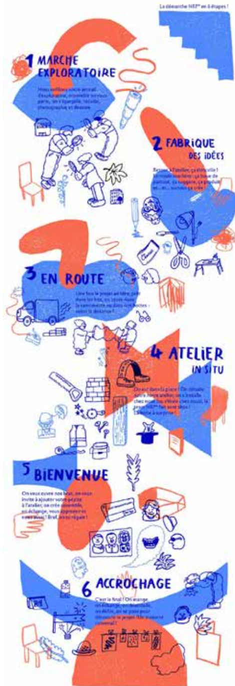
La démarche de Ne Rougissez Pas

Agence culturelle indépendante, des ricochets sur les pavés invite des équipes artistiques à inventer des oeuvres spécifiques et contextuelles pour les paysages (humains, patrimoniaux, historiques) de la Bièvre. A travers ces créations in situ, imaginées sur mesure, les artistes interviennent sur des espaces en transformation en y inscrivant leur sensibilité.