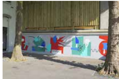
FRESQUE MURALE Maison de Quartier d'Ivry-Port Juillet 2017 Fresque, Peinture, Pochoirs