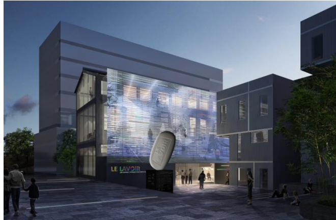
Vue depuis la rue Freiberg

Une convention tripartite a été signée le 22 décembre 2015 entre la commune de Gentilly, l'établissement public territorial Grand Orly Seine Bièvre et la SemPariSeine, portant sur la participation du Territoire Grand Orly Seine Bièvre aux équipements publics de la ZAC pour un montant de 182 627,00 € HT.