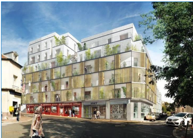
Vue depuis l'avenue Paul Vaillant Couturier

Avancement du projet : Travaux en cours depuis juillet 2015 – Livraison juin 2017.