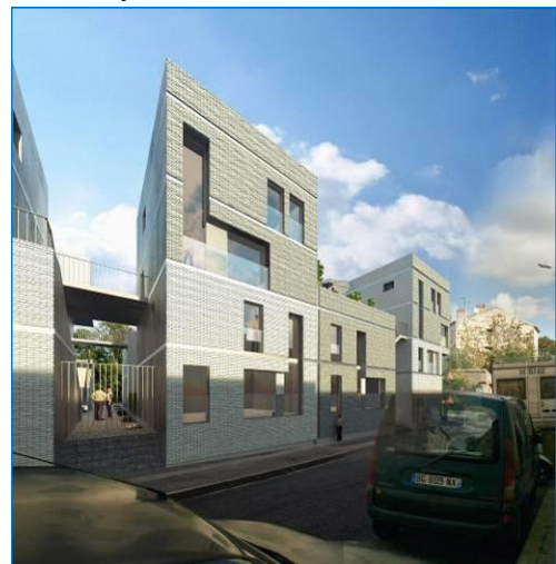
Vue depuis la rue Marquigny