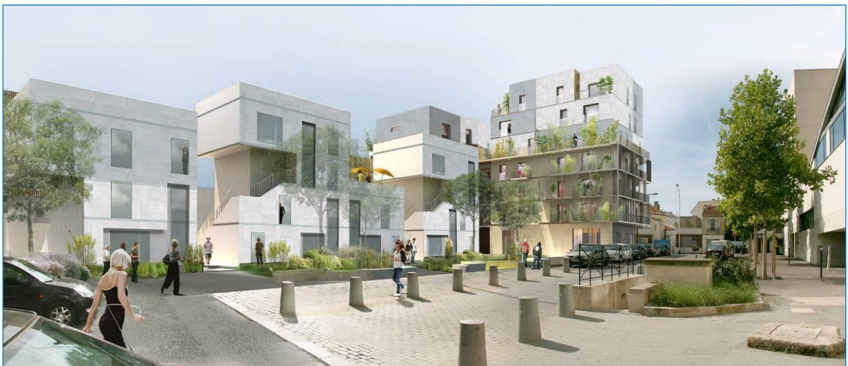
Vue depuis la rue Freiberg

La venelle publique située entre les lots 1 et 3 restera inaccessible pendant la durée du chantier du Lavoir (lot 3). En revanche, l'accès direct au square pour les futurs habitants du lot 1, est maintenu par les autres escaliers.