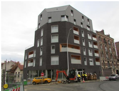
Vue depuis l'avenue Paul Vaillant Couturier