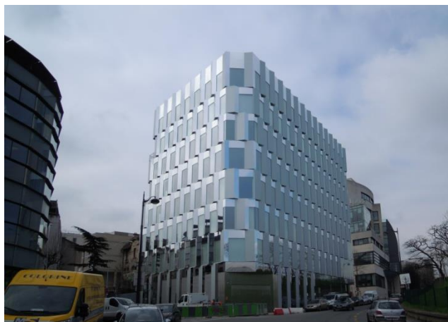
Vue depuis la rue du Val de Marne