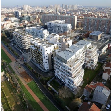
Lots A, C et D