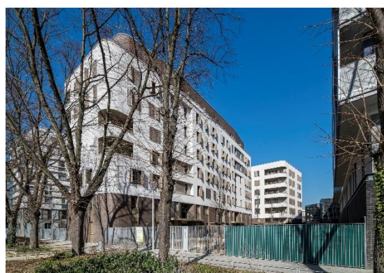
Lot B (logements locatifs libres) Foncière Logement/Bouygues Immobilier