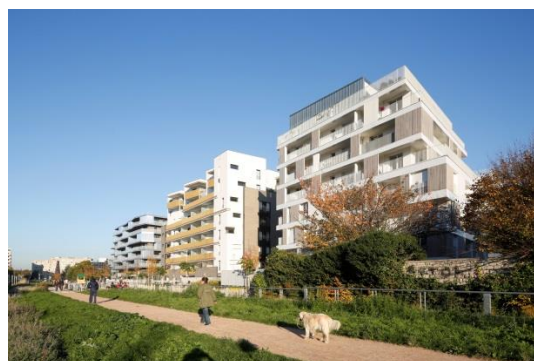
Lots A, C et D (logements en accession et sociaux) EIFFAGE Immobilier Ile-de-France