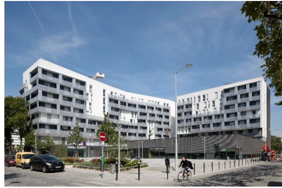
Lot E (résidence pour étudiants et chercheurs, gymnase et Maison Régionale des Sports)