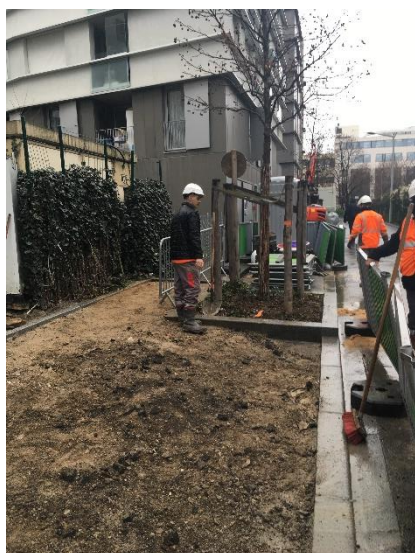
Trottoir rue des Carrières en cours de réalisation