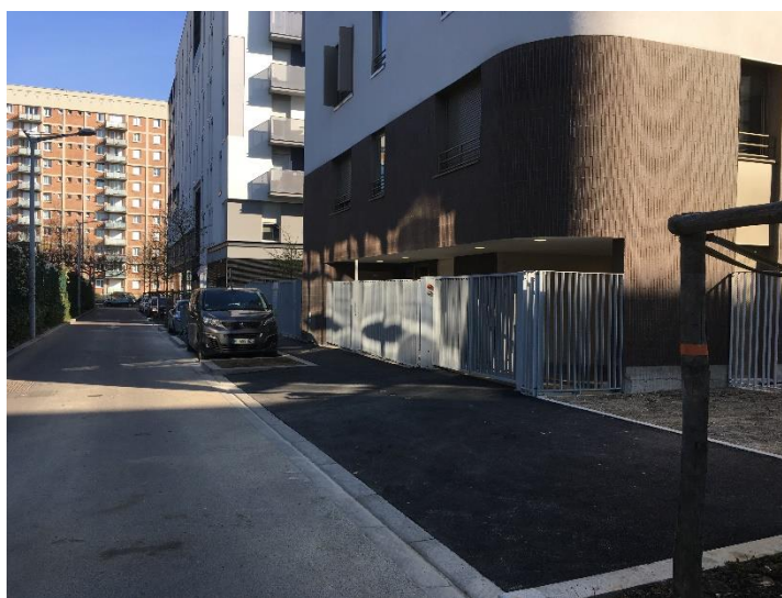
Trottoir rue des Carrières achevé en mars 2019