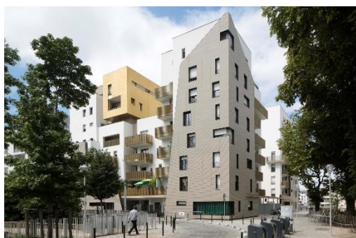
Lot C (logements en accession et sociaux) EIFFAGE Immobilier Ile-de-France