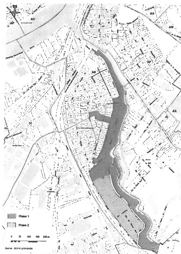
Secteurs du phasage du projet de restauration de la plaine inondable de l'Yerres - EPA ORSA

L'extension à une nouvelle zone, correspondant à la création d'une zone humide (parties des numéros pairs du chemin des Pêcheurs et de la rue du Blandin - phase 1 sur la carte ci-dessous), a été actée en novembre 2019, associant les partenaires actuels et de nouveaux (EPA ORSA, Métropole, Région).