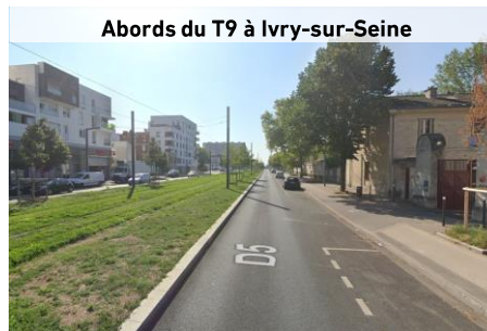
Abords du T9 à Ivry-sur-Seine