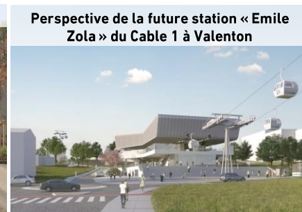
Perspective de la future station « Emile Zola » du Cable 1 à Valenton