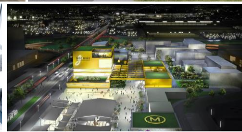
Vue des abords de la future cité de la gastronomie, Chevilly-Larue / Thiais