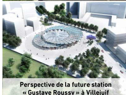
Perspective de la future station « Gustave Roussy » à Villejuif